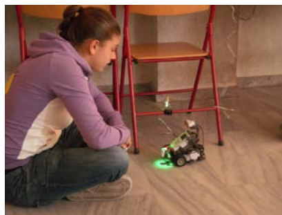
Σχήμα 1. Στιγμιότυπα από τις προσπάθειες των μαθητών